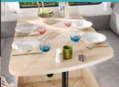
Tafel Sport Line