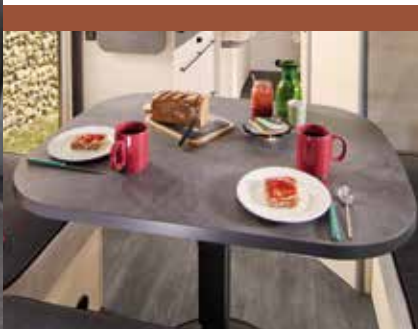
Tafel Exclusive Line